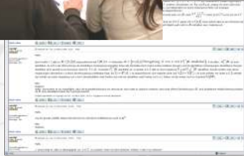
Trainings als Vorbereitung auf ein Mathematikstudium - weltweit nutzbar!