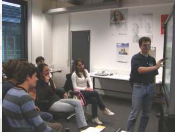
Exkursionen: Treffen der anderen Teilnehmer in real life und Gewinn neuer Perspektiven...